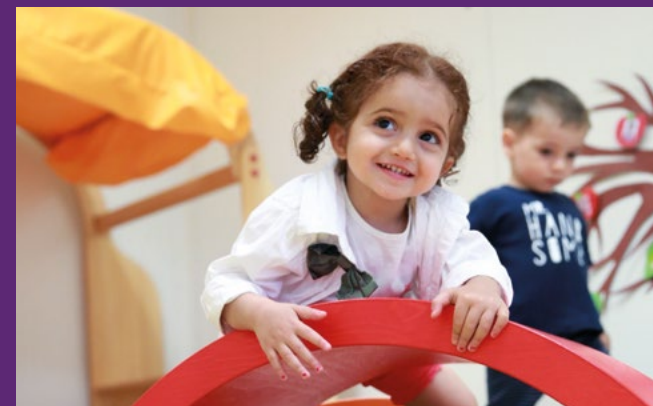
Kinder- und Jugendhilfe