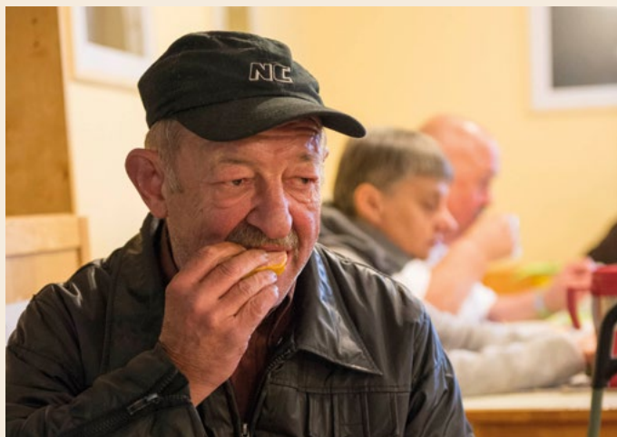
Armutsbekämpfung und -prävention

Seit 1885 engagiert sich die Stadtmission Nürnberg für Menschen, die unter Ausgrenzung und Armut leiden. Und seit 2007 finanzieren Stifter*innen durch ihre Einlagen bei der Stiftung HILFE IM LEBEN dieses Engagement mit. Mehr als 180.000 Euro wurden bereits an Projekte der Stadtmission für hilfsbedürftige Menschen ausgeschüttet – unabhängig von deren Weltanschauung und Konfession. Ganz bewusst ist die Förderung auf den Großraum Nürnberg-Erlangen beschränkt.